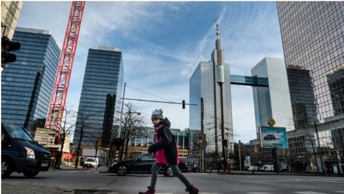
De Proximus-torens (met loopbrug) staan al een tijd leeg.

De beursgenoteerde vastgoedontwikkelaar Nextensa koopt het hoofdkwartier van Proximus aan het Brusselse Noordstation. Tegen 2029 moeten alle werknemers van het telecombedrijf in een gebouw op Tour & Taxis werken, waarvoor Nextensa nog geen vergunning heeft.